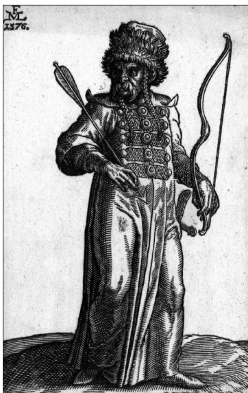
Рис. 2. Мелхиор Лорк. Татарский лучник. 1576 г.

Флетчер определенно различал крупномасштабные походы крымских татар, целью которых был поход на столицу, и грабительские походы на окраинные территории Русского государства малыми силами: «когда идет войною сам Великий или Крымский Хан, то ведет он с собой огромную армию в 100 000 или 200 000 человек. В противном случае, они делают кратковременные и внезапные набеги с меньшим числом войска, кружась около границы, подобно тому, как летают дикие гуси, захватывая по дороге все, и стремясь туда, где видят добычу» (Там же. С. 76). Еще в начале мая 1591 г. крымские перебежчики показали, что на Москву Казы-Гирей идет более, чем со 150 000 войском, т. е. «со всей ордой». Помимо крымчаков в походе приняли участие Малая Ногайская орда (Казыев улус), турецкие конные отряды из Очакова и Белгорода, а также янычары. Вторжение сопровождалось движением полевой артиллерии с турецкими пушкарями в придачу (РК 1475–1598. С. 440–441; ПСРЛ. Т. 14. С. 42; Зимин 1986. С. 177–178; Скрынников 1981. С. 89).