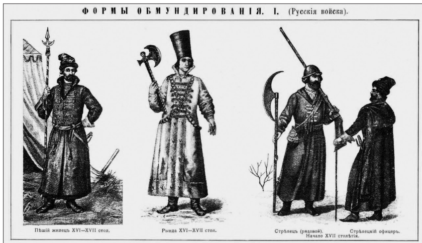
Рис. 4. Обмундирование и вооружение русского войска в XVI в. Fig. 4. Equipment and weaponry of Russian army in the 16 th century.