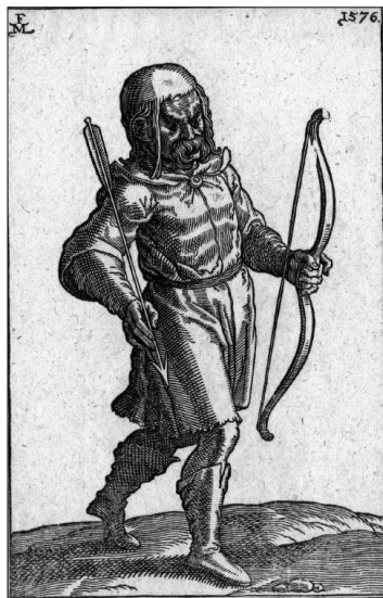
Рис. 3. Мелхиор Лорк. Татарский воин, 1576 г.