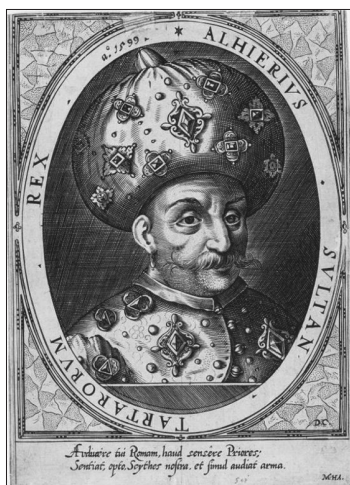
Рис. 1. Крымский хан Казы-Гирей. Fig. 1. Crimean Khan Ğazı Giray.

Считается, что впервые гуляй-город был использован при взятии Казани в 1552 г. Решающую роль он сыграл в 1572 г. в сражении при Молодях. Собирались применить гуляй-город и для отражения конницы Казы-Гирея. Уже весной 1591 г. тревожные слухи о готовящемся походе крымчаков заставили правительство принимать решительные меры к обороне Москвы. Важнейшим оборонным мероприятием этого времени было возведение гуляй-городов (Флетчер 2014. С. 69–70). Отказ Михаила Нагого предоставить людей под гуляй-город, в то время, когда грозит очередное нашествие татар, вполне тянул на государственную измену. Таковыми в преддверии нападения грозного и опасного врага представлялись бунт в Угличе и Москве. Брожения умов, заквашенные на слухах о насильственной гибели царевича Дмитрия,