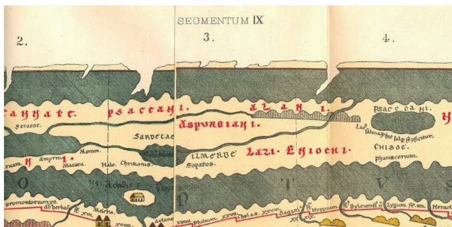
Илл. 4. Певтингерова карта. Псакканы, аспургианы, аланы (IX, 2 – IX, 4) ( https://www.tabula-peutingermana.de/tabula.html?segm=8 ). Fig. 4. Peutingerman's map. Psaccans, aspurgians, alans (IX, 2 – IX, 4) ( https://www.tabula-peutingermana.de/tabula.html?segm=8 ).